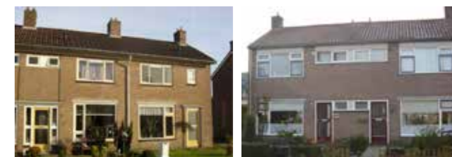
Huidige situatie Pitrietstraat (links) en Nieuwstraat (rechts), Noordwolde

Voor huurders kan de sloop van hun woning heel ingrijpend zijn. Daarom geldt voor deze huurders, met positief advies van De Bewonersraad Friesland, een sociaal pakket. Hierin staat waar zij recht op hebben bij sloop en nieuwbouw. Denk bijvoorbeeld aan een tegemoetkoming in de verhuiskosten en voorrang bij toewijzing van een andere huurwoning. Ook staat daarin hoe wij omgaan met veranderingen die door de huurder in het 'oude' huis zijn aangebracht. Zo proberen we het proces van sloop en verhuizing zo goed mogelijk te laten verlopen voor huurders.