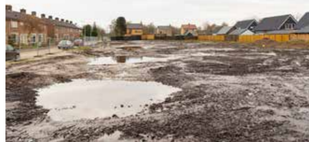
Locatie gesloopte woningen Pitrietstraat 2 t/m 28, Noordwolde

De bouw start, zoals het nu lijkt, in maart 2022. Als alles volgens plan verloopt, krijgen de nieuwe huurders de sleutel na de zomervakantie van 2022.