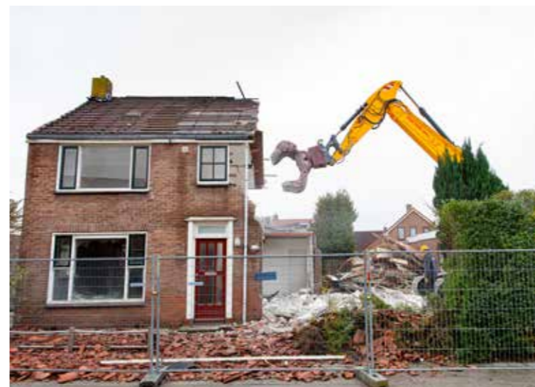
Sloop Zilverlaan, Wolvega

De bouw begint waarschijnlijk eind maart 2022. We verwachten dat ook deze huurders de sleutel na de zomervakantie van 2022 kunnen krijgen.