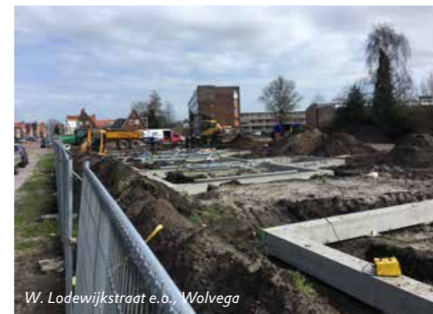
W. Lodewijkstraat e.o., Wolvega

palen en deels 'op staal'. Op het moment van fotograferen stokte in Noordwolde ook nog het betonstorten: de betonpomp was stukgegaan. Over enkele weken zijn de vorderingen op beide bouwplaatsen veel opvallender.