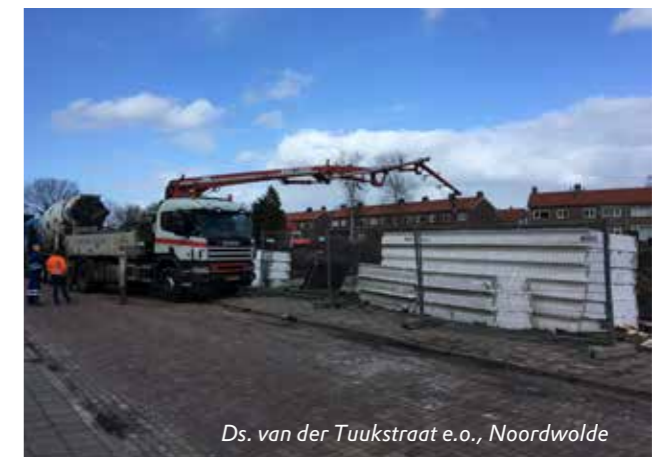
Ds. van der Tuukstraat e.o., Noordwolde